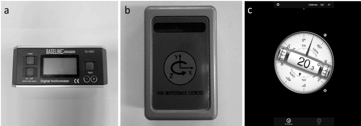
Figure 2. Digital inclinometer (a), inertial measurement unit (b), clinometer application (c)

무릎뽐 각도는 넓적다리가쪽위관절염기(lateral epicondyle of the femur)를 축으로 넓적다리큰돌기(greater trochanter of the femur)와 종아리가쪽복사(lateral malleolus of the fibula) 사이의 각을 측정한다. 각도계(goniometer), 전자 경사측정기(digital inclinometer)(Figure 2a), 를 주로 사용하며 (Davis 등, 2008; Neto 등, 2015; Youdas 등, 2010), 최근에는 관성 측정장치(inertial measurement unit)(Figure 2b) 및 스마트폰(smartphone)(Figure 2c)의 활용도가 점차 높아지고 있다 (Dos Santos 등, 2017; Gnat 등, 2010; Oh 등, 2019). 신뢰도 평가와 같은 특정한 목적이 있는 경우가 아니라면, 측정은 주로 2회 또는 3회를 수행하며 평균값을 사용한다 (Hamid 등, 2013; Neto 등, 2015; Norris와 Matthews 2005).