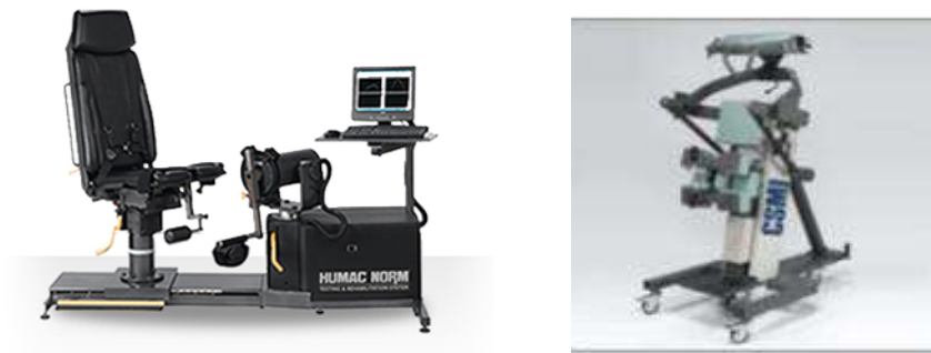
그림 1. HUMAC NORMTM Testing & Rehabilitation System

본 연구에서는 HUMAC NORMTM Testing & Rehabilitation System을 사용하여 몸통의 굴곡과 신전의 최대 토크와 전체 일, 그리고 평균 일을 측정하였으며, 몸통의 굴곡과 신전 패턴을 이용하기 위해서 별도의 옵션장치인 TRUNK MODULAR COMPONENT(TMC)를 사용하였다(그림 1). 관절의 고정은 슬관절 위와 아래, 그리고 고관절 높이에서 벨트를 이용하여 각각 고정하였고, 가슴높이에서 손을 잡을 수 있는 장치로 상체를 고정하였다.