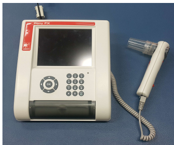
그림 2. 폐활량측정기 (pony Fx, COSMED srl, Italy)