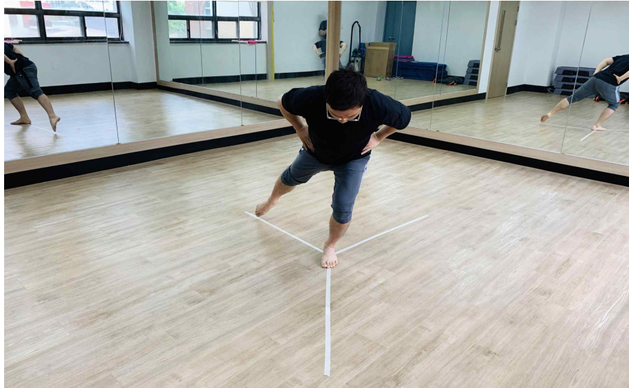
Figure 2. Y-balance exercise

Y-balance 운동은 Y선의 가운데 한쪽 발을 놓고, 한발로 선 자세에서 운동을 시작하였으며, 바닥에 놓여있지 않은 반대쪽 다리를 이용하여 Y 모양의 세군데 방향을 향해 운동을 실시 하였다. 운동 시 다리는 최대한 뻗으며 운동을 진행 할 수 있도록 지시하였다. 운동의 진행은 비손상측 발을 지면에 먼저 닿은 상태에서 진행하였으며, 이후 손상측 발을 지면에 놓고 운동을 진행하게 하였다. 운동 시 다리를 뻗는 순서는 앞쪽, 뒤가쪽, 뒤편쪽으로 진행하였다. 운동은 1세트(set)에 10~15개(rep)로 구성하였으며, 하루에 총 3세트의 운동을 진행하였고, 이를 주 3회, 4주간 진행하였다.