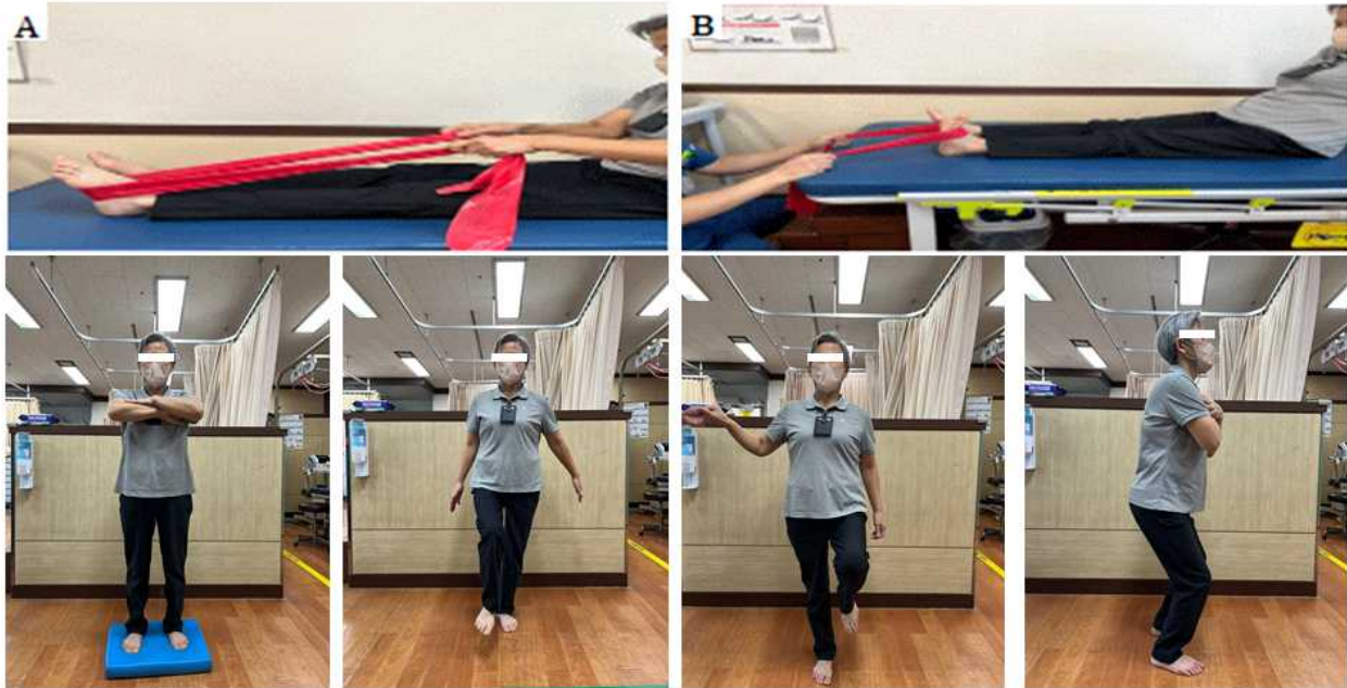
Figure 4. therapeutic exercise

본 연구에서 적용된 치료적 운동은 Kaminski 등(2003)의 연구와 Smith 등(2012)의 연구에서 환자의 능력에 맞게 치료적 운동 프로그램을 수정 및 보완하여 수행하였으며 발목 관절가동술 적용 전 10분간 실시하였다. 총 4개의 프로그램으로 첫 번째는 탄성밴드를 이용한 발등 굽힘 및 발바닥 굽힘 근력강화 운동 두 번째는 고유 감각 향상을 위한 세미 스퀴트, 세 번째는 눈을 뜨고 감은 상태에서의 한발서기 훈련 마지막 네 번째는 불안정한 지면에서의 균형훈련이 포함되어있다. 4개의 세션을 모두 포함하여 10분간 적용하여 실시하였다(Figure 4).