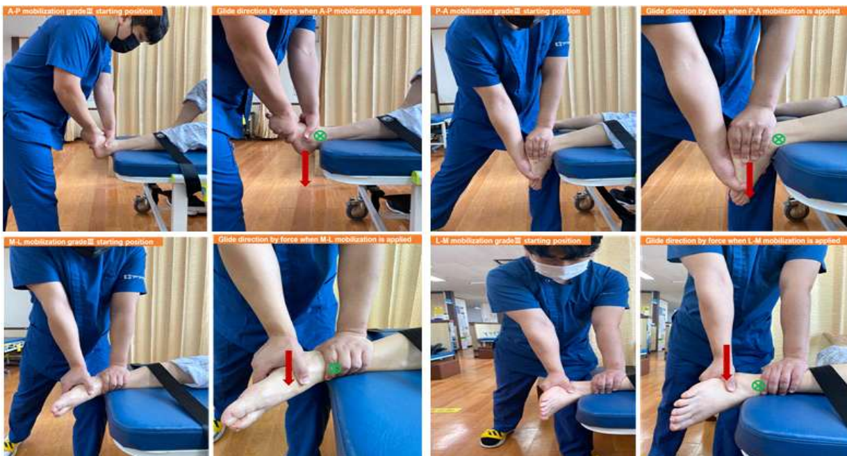
Figure 3. Ankle joint mobilization

본 연구에서 발목 관절가동술은 발목관절의 발등굽힘과 발바닥굽힘 증진을 위해 Talocrural joint anteroposterior mobilization, Talocrural joint posteroanterior mobilization을 적용하였으며 안쪽번짐과 가쪽번짐 증진을 위해 Subtalar joint mediolateral mobilization, Subtalar joint lateromedial mobilization을 적용하였다. 관절가동술 방법은 메이틀랜드 관절가동술 3등급을 적용하였으며 메이틀랜드의 가동술은 통증완화와 관절과 관절주위 결합조직의 유연성을 증가시키며 통증완화를 목적으로 할 때는 1,2등급을 적용하며 관절가동범위의 시작과 중간지점에서 움직임이 이루어지고, 관절가동성 증가를 목적으로 할 때는 3,4등급을 적용하는데 관절가동범위 끝범위에서 움직임이 이루어진다(Figure 3).