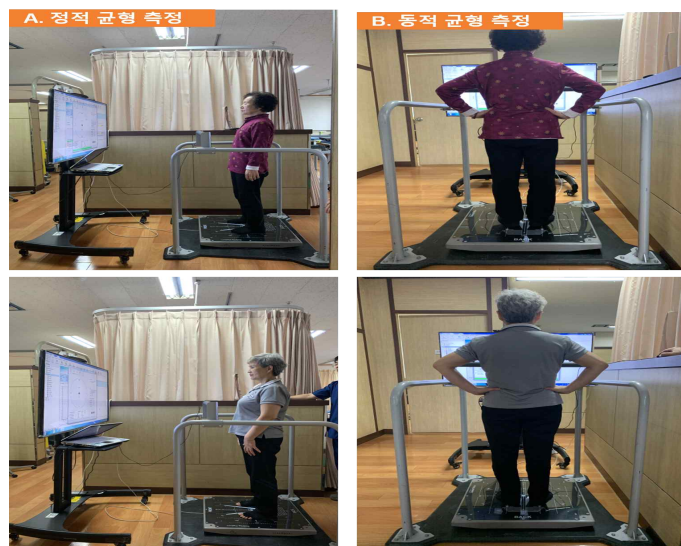
Figure 2. measurement of balance ability

BT-4(Bt-4, Hur lab, Finland)를 이용하여 균형능력을 평가하기 위하여 자세 동요면적(Postural Sway Area; PSA)과 자세 동요거리 그리고 안정성 한계(Limit of Stability; LOS) 값을 측정하였다. BT-4는 사각형의 형태로 각 꼭지점에 측정 센서가 내장되어 있어 측정 센서를 통해서 연구 대상자의 압력중심을 찾아내고 그에 따른 자세 동요면적과 자세 동요 거리를 분석 측정하여 균형능력을 측정 할 수 있다. 대상자는 BT-4 플랫폼에 올라서서 양 발의 뒤꿈치 간격을 2cm로 유지한다. 발의 각도는 약 15도씩 외측으로 향하게 하고 손은 자연스럽게 위치하고 30초간 눈을 뜬 상태와 눈을 감은 상태에서 정적 균형(Static Balance)능력을 측정하였다. 정적 균형능력이 좋을수록 자세 동요면적과 동요거리가 좁고, 정적 균형능력이 나쁠수록 자세 동요면적과 동요거리가 넓다고 해석한다(Borg Laxåback, 2010). 또한 동적 균형(Dynamic balance)능력 측정은 대상자는 플랫폼 위에 올라선 상태에서 양발을 움직이지 않고, 앞·뒤 및 왼쪽·오른쪽 방향으로 최대한 몸을 기울여 안정성 한계의 이동범위 값을 측정하였으며 동적 균형능력이 좋을수록 이동범위 값이 증가하며, 나쁠수록 이동범위 값이 감소한다고 해석한다.(Figure 2).