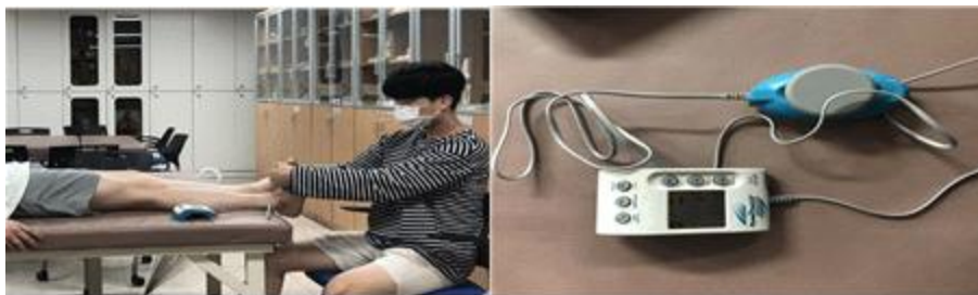
Figure 2. Jtech power track II

바로누운자세에서 키네시오 테이프 부착 전·후 각각 2회씩 총 4회 발목관절의 발등굽힘(Dorsi flexion), 발바닥 굽힘(Plantar flexion), 안쪽번짐(Inversion), 가쪽번짐(Eversion)의 근력을 전자근력측정기(Jtech power track II, Pro healthcare products, USA)를 이용해서 측정하여 평균값을 사용하였다(Kasukawa et al., 2019). 측정은 중립상태에서 시작하고, 대상자의 최대근력에 맞는 저항 장벽을 만들어 실시하였으며, 상지의 보상 없이 가능한 순수한 발목근력(lbs) 만을 측정하였다(John J. Fraser 등, 2017)(Figure 2).