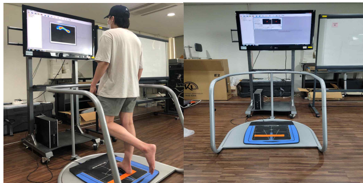
Figure 4. Biorescue

바이오레스큐(Biorescue, RMIngenierie, France)를 이용하여 몸의 중심점 이동 경로를 측정하여 면적(Surface area ellipse mm 2 ), 길이(Length, cm), 평균속도(Average speed, cm/s)를 측정하였다. 모든 항목은 측정값이 낮을수록 균형능력이 좋을 수 있다(박한규, 2017). 플랫폼에 선 자세에서 비우세발을 무릎 90°굽힘 하여 한 발 서기 자세를 취한 후 우세발로 균형을 유지하고 눈을 뜬 상태로 회당 15초간 진행하였다(김가현 등, 2015). 키네시오 테이프 부착 전·후 각각 2회씩 총 4회 균형능력을 측정하여 평균값을 사용하였으며, 지면에 두 발이 모두 닿았을 경우에만 재측정하였다(Figure 4).