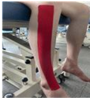
Figure 1. Kinesio taping method

키네시오 테이프는 2.5cm, 3.75cm, 5cm, 7.5cm 4종류가 있으며 색상은 살색, 적색, 청색 등이 있다. 보편적으로는 눈에 잘 띄지 않는 살색을 사용하며 적색과 청색은 시각효과 이외에 차이가 없다. 테이핑 방법에는 I자형, Y자형, X자형, 손가락형이 있으며(전상은, 2011) 본 연구에서는 대상 근육인 앞정강근의 구조 특성을 고려하여 I자형 테이핑을 적용하였다(김은자와 이경보, 2019). 테이프 부착부위는 정강뼈 가쪽관절융기 아래에서 시작해서 정강뼈 근힘살 끝나는 부분까지 적용하였으며, 무릎 90°굽힘 상태에서 발목을 최대한 발등굽힘, 안쪽번짐 시키고 테이프를 적용한다. 10%G은 키네시오 테이프를 10% 장력을 주어 늘려서 적용하고, 0%G은 장력 없이 적용하였다(이동윤, 2018)(Figure 1).