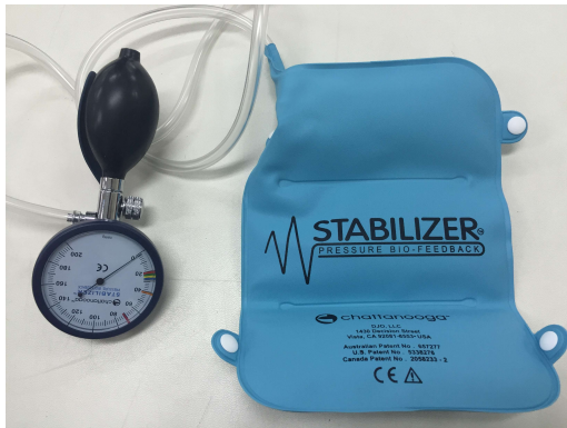
그림 1. 생체자기제어측정기