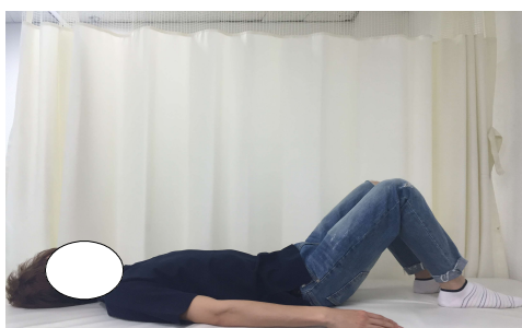
그림 3. 교각운동 기본자세