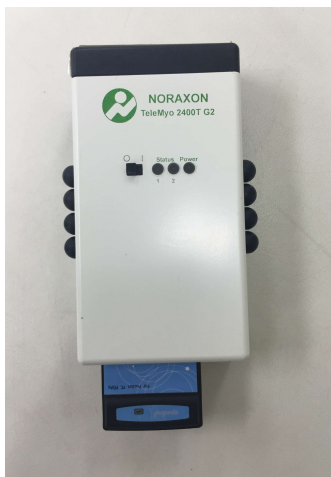
그림 2. Telermyo 2400T G2