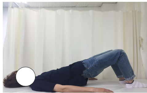
그림 4. 교각운동 시작자세